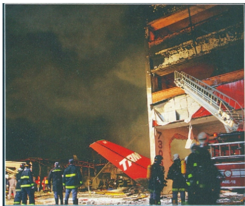
Rescue workers in São Paulo, Brazil, survey the damage after a Tam Airlines Airbus 320 overshoot the runway at Congonhas airport in pouring rain and crashed into airport buildings, killing some 200 people. The crash has raised questions over the safety of the airport, the busiest in Brazil, with some claiming the runway is too short and its drainage inadequate.

A second major air disaster in ten months has left Brazilians stunned and brought into question the ability of the authorities to manage the country's increasingly overstretched and crisis-stricken aviation network.