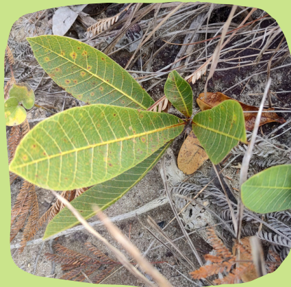
Parte da Floresta Subterrânea.

Existe uma floresta subterrânea localizada na Serra de Ouro Grosso (município de Itutinga). Esta espécie de jacarandá da foto tem a estimativa de 3800 anos de vida.