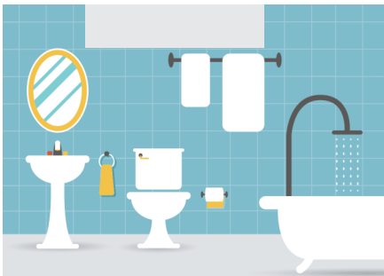
⚠ BANHEIRO - Umidade, calor, fácil acesso