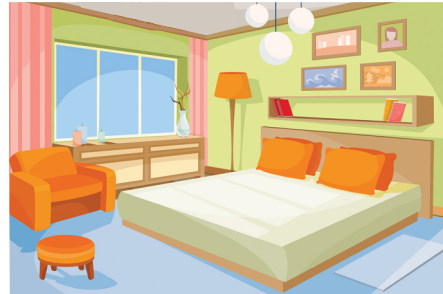
✔ QUARTO - Dentro do armário, nas prateleiras mais altas, onde estarão protegidos do sol e fora do alcance das crianças e de animais de estimação