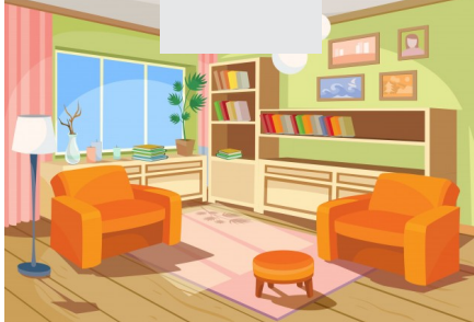
⚠ SALA - Fácil acesso