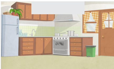
⚠ COZINHA - Umidade, calor, fácil acesso