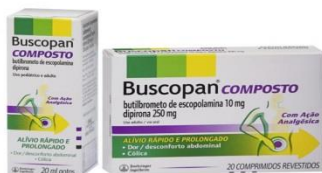
Figura 1: Buscopan Composto