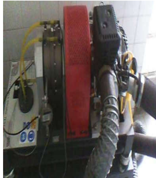
Fig.14: Bancada de Motores com Dinamômetro