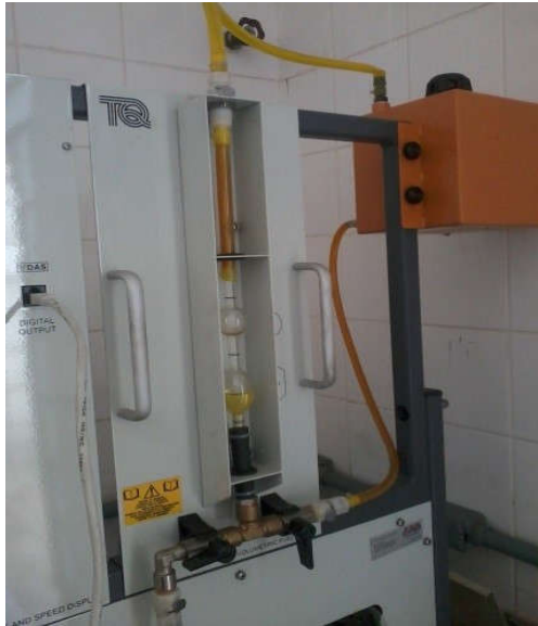
Fig.13: Bancada de Consumo de combustível