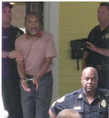
Henry Louis Gates Jr. been handcuffed and arrested