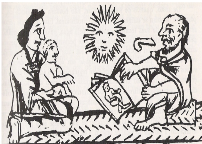
“Consulta ao adivinho e ao livro” Fonte: TODOROV:1988, p.63.

O encontro entre o Velho e o Novo Mundo, a Europa e a América, representou o confronto entre modos de vida totalmente diferentes.